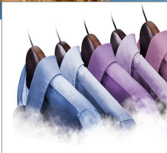
ULTIMATE Fer Vapeur FV9711C0